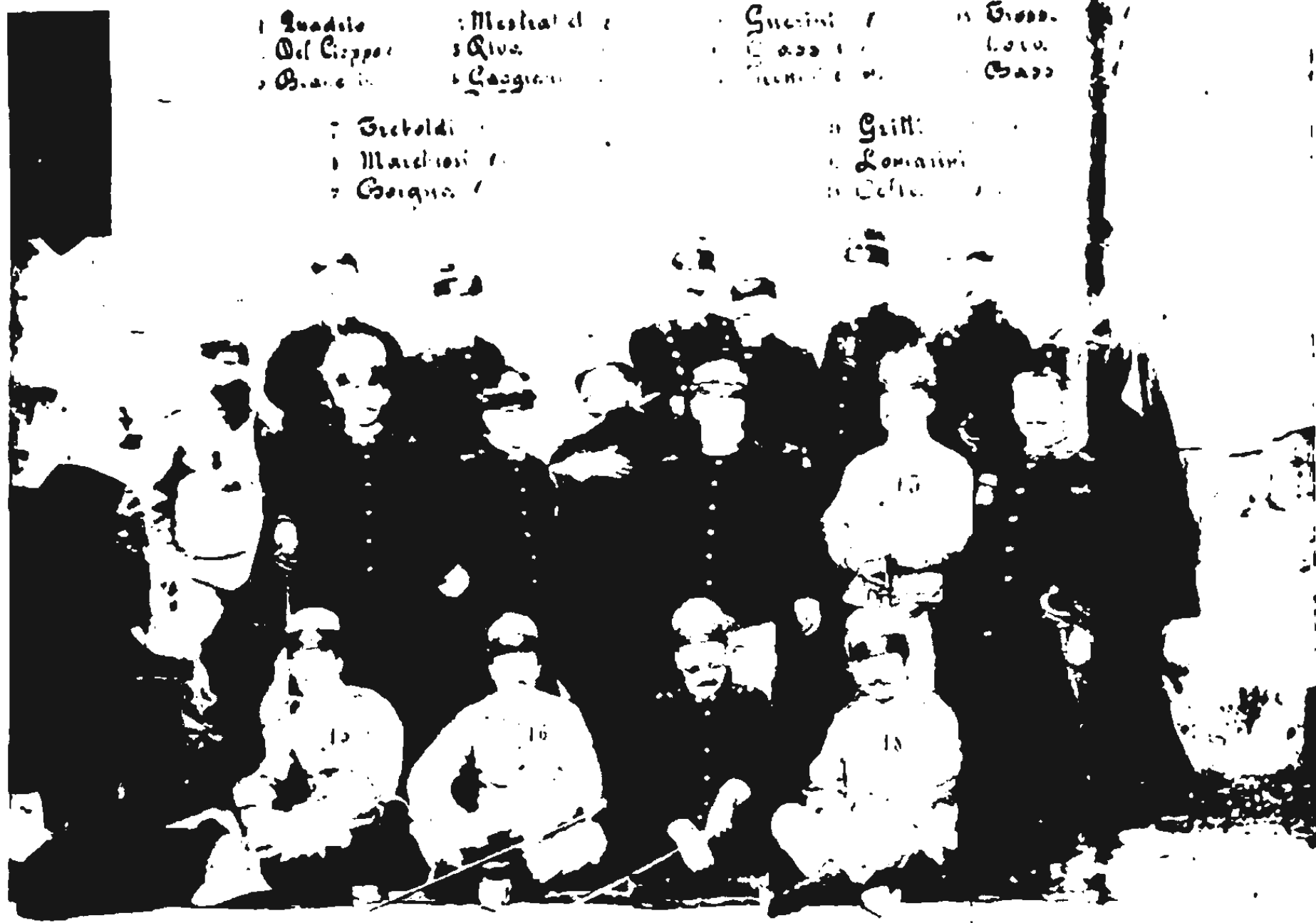
Battaglione Alpini d'Africa che partecipò alla battaglia di Adua (1° marzo 1896)

Gli ufficiali del Battaglione Alpini d'Africa che partecipò alla Battaglia di Adua dell'1° marzo 1896.